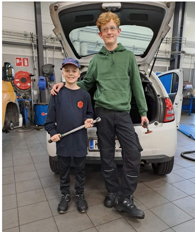
Praktikanter fra 7. klasse